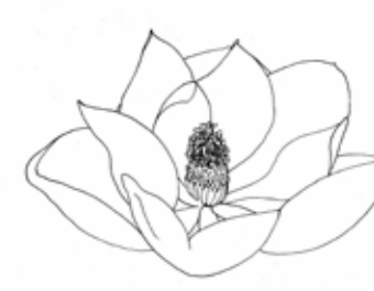
FLEUR DE MAGNOLIA