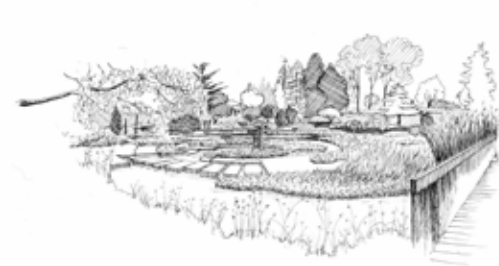
LE JARDIN D'IRIS