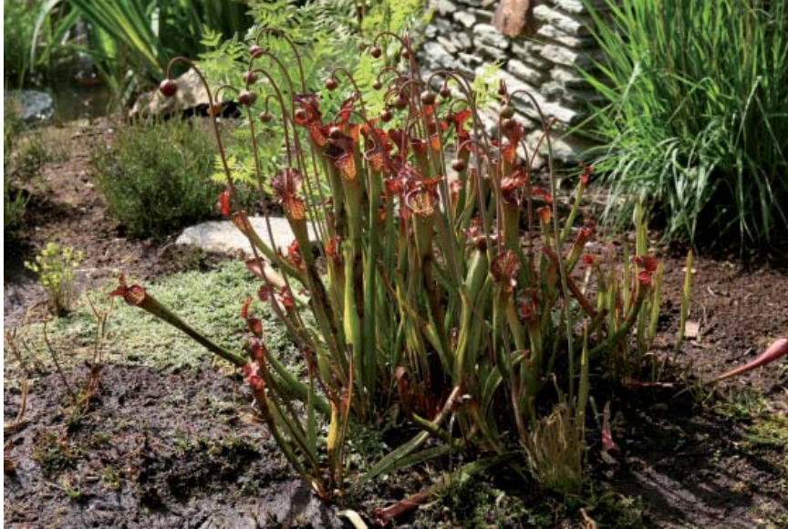
Massif de sarracénies.

majorité des plantes carnivores, vivent dans des lieux ensoleillés, détrempés et acides dans lesquels l'azote est faiblement disponible : les tourbières à sphaigne. Une des adaptations de ces végétaux pour assimiler l'azote nécessaire à leur croissance consiste à capturer de petits animaux et d'en consommer les protéines.