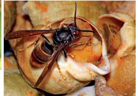
Frelon à pattes jaunes sur un étal de poissonnier.

vivent pas à l'hiver. Quant à celles qui restent en vie, 90 % d'entre elles sont victimes des combats entre femelles fondatrices.