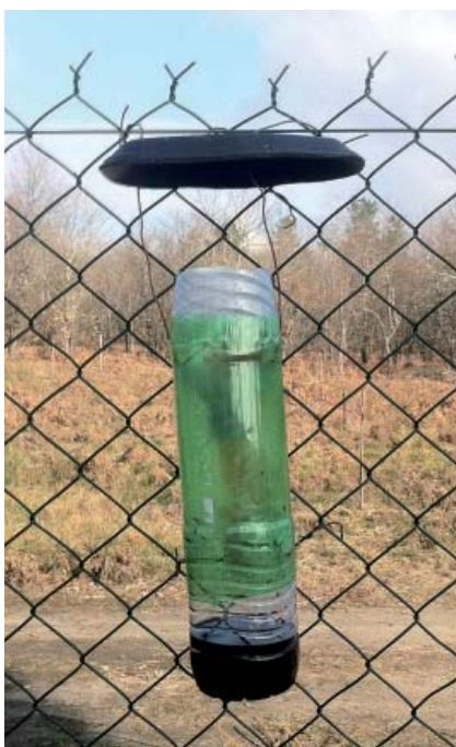
Piège artisanal pour la capture du Frelon à pattes jaunes. Internet regorge de témoignages, de recettes, plans et photographies encourageant ces pratiques.

Le Muséum d'Histoire naturelle de Nantes a procédé à l'examen du contenu de 203 urnes prélevées en mars 2015. Au total, 1 388 insectes (et quelques autres arthropodes ou gastéropodes) ont été collectés, représentant 4 familles appartenant à 3 ordres. En termes d'abondance, les Diptères figurent au premier rang (702 spécimens appartenant à deux familles, les Scatophagidés et les Calliphoridés et trois genres respectivement : Scatophaga , Calliphora et Lucilia ), suivis des Hyménoptères Vespidés avec 673 Frelons à pattes jaunes, 6 Frelons européens