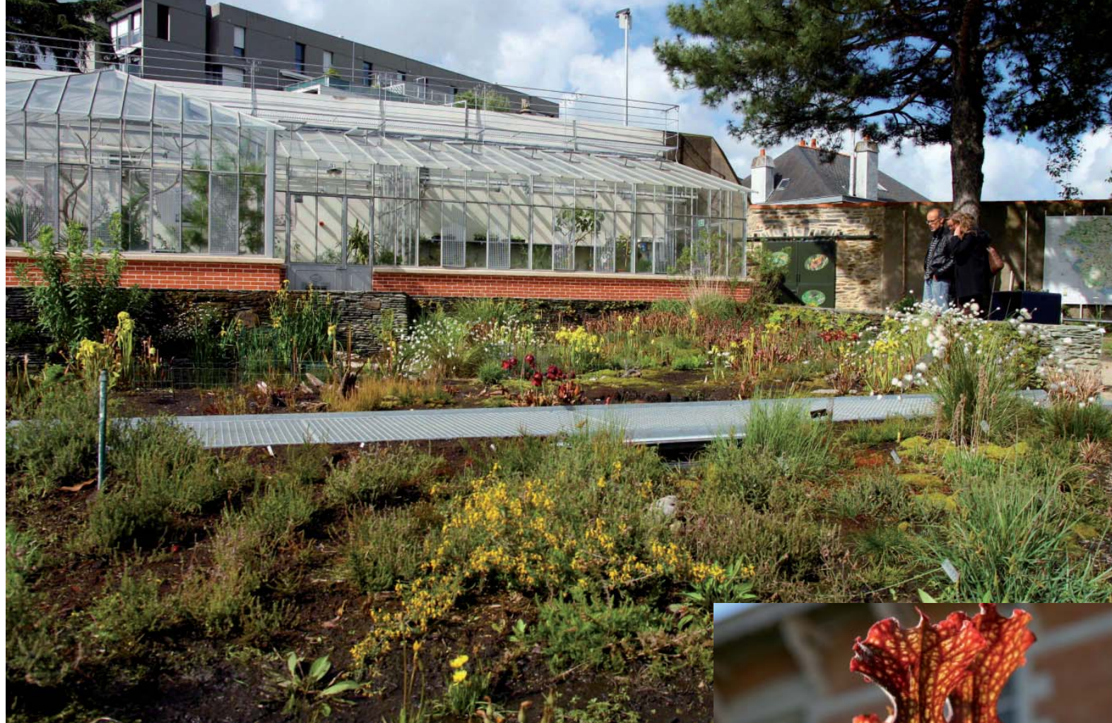
À droite devant la serre du jardin des plantes de Nantes, une mini-tourbière héberge une population de sarracénies. Ci-contre, urnes de Sarracenia .

Par François Meurgey et Romaric Perrocheau