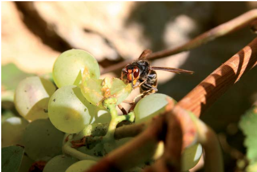
Frelon à pattes jaunes sur grains de raisin. - Cliché Franck Muller / MNHN