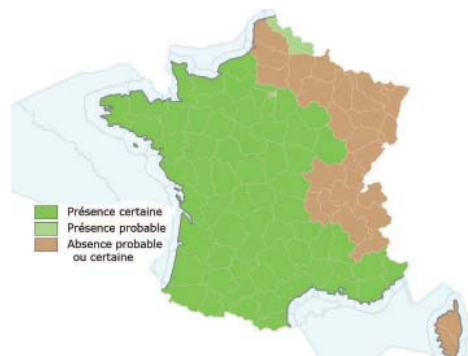
Carte de répartition du Frelon asiatique à pattes jaunes en France métropolitaine et Corse en 2014.

nir à bout. Il convient de rappeler que le piégeage préconisé au printemps contre les reines fondatrices est inefficace. Il favorise la survie des reines en les privant de batailler contre leurs congénères. Plus précisément, 90 % des femelles ne sur-