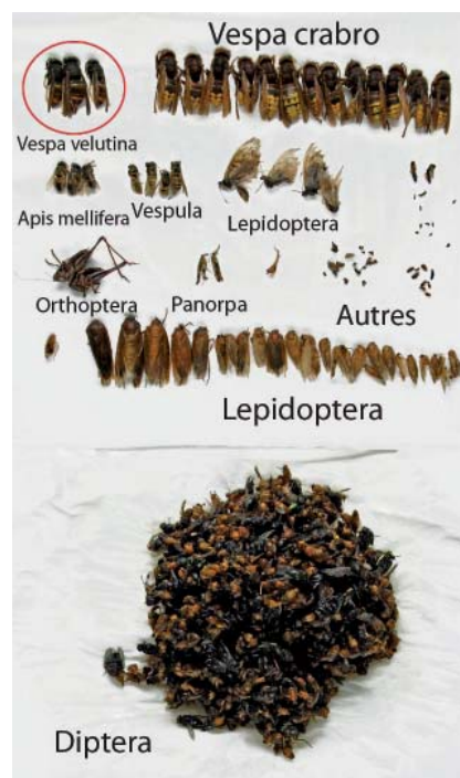
Impact du piégeage non-sélectif sur l'entomofaune. Les Frelons à pattes jaunes (en haut à gauche) sont très largement minoritaires.